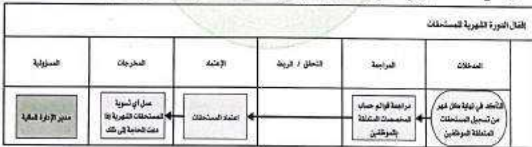
شكل رقم ٥

يوضح المخطط البياني التالي ( شكل رقم ٥) طريقة تسلسل العمل لإقفال الدورة الشهرية للمستحقات: